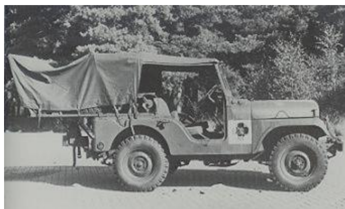
Afb. 03: Gewondentransporteur. Jeep, M 38A I, 1/4 ton, 4x4, 24V. (Willys Overland).

Met de reductiebak van het merk Spicer type 18 werd de terreinvaardigheid van de M38A1 verhoogd. De reductiebak was tegen de versnellingsbak en voor de beide assen gemonteerd. De reductiebak telde twee overbrengverhoudingen. Tevens kon met de reductiebak de vieraandrijving worden ingeschakeld. Indien noodzakelijk, zoals bij de lasjeep, was op de reductiebak een krachtafnemer worden gemonteerd. Op de uitgaande as van de reductiebak, naar de achteras is de handrem gemonteerd.