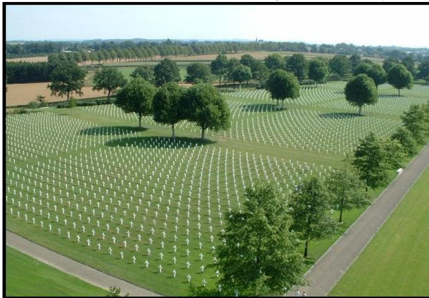
Overzichtsfoto "World War II Netherlands American Cemetery and Memorial".

Drie weken na de Duitse capitulatie en wel op 30 mei 1945 vond de eerste Memorial Day plaats. De bewoners uit zestig Limburgse dorpen bedolven de begraafplaats onder een zee van bloemen. Ruim 200 inwoners uit de directe omgeving werkten de hele nacht door om met de aangeleverde kransen en bloemen de graven te versieren. Bij deze eerste herdenkingsdienst gaven een groot aantal divisie-, legerkorps- en legercommandanten acte pressante. Onder hen de commandant Negende US Leger, General Simpson. Ook nu werden saluutschoten afgegeven en wel door vier 105-mm artillerievuurmonden.