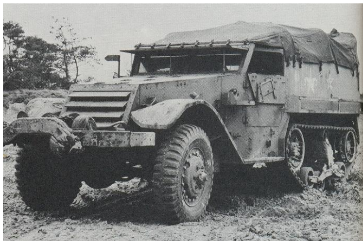
Afb. 03: Een Pantserauto, Personeel, M9A1, ¾ ton met lierinstallatie verplaatst onder terreinomstandigheden.

Op essentiële locaties is het chassis versterkt in verband met het monteren van de aandrijflijn en noodzakelijke componenten. Op deze wijze heeft de producent een stabiel en solide chassis gecreëerd. Naast de aandrijflijn dient het chassis als montageplatform voor de, stuur-, reminrichting, lierinstallatie en de gepantserde opbouw.