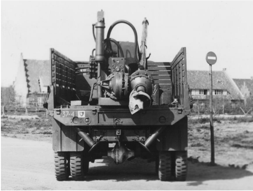
Afb. 5: Grondboorinstallatie op vrachtauto.