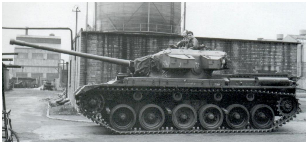
Afb. 03: Elke geproduceerde gevechtstank werd voor de aflevering onderworpen aan een testrit.

De bevindingen van beproeving werden op 22 augustus 1945 tijdens de 22ste vergadering van de Adviescommissie van DRAC besproken. Aangezien het beproevingsrapport geen punten van grote kritieken kenden, werd een productieadvies gegeven voor de levering van 800 gevechtstanks Centurion. Van het type A41* ook wel gevechtstank Centurion Mark I [later gewijzigd in Mk 1], FV 4007 werden er honderd geleverd. De A41* was bewapend met de 17-pounder vuurmond met coaxiaal gemonteerd een 7,92-mm Besa mitrailleur. De resterende 700 gevechtstanks waren van het type A41A ook wel de gevechtstank Centurion Mark II [later gewijzigd in Mk 2]. De eerste 100 gevechtstanks Centurion Mk II diende evenals de Mk I bewapend te worden met de 17-pounder vuurmond. De overige gevechtstanks dienden met een meer recentere vuurmond te