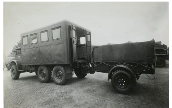
Afb. 17 :

Het wielvoertuig van het type F60B fungeert als dragend wielvoertuig voor een Bofors luchtafweervuurmond. Voor de montage van de 40 mm lang 60 Bofors Luchtafweervuurmond was men genoodzaakt het chassis te versterken. De totale massa van het wielvoertuig met wapeniging kwam daardoor uit op 6.078 kilogram. Als basis voor het dragend wielvoertuig is gebruik gemaakt van vrachtauto: 4x4, 3 ton, Ford waarbij onder meer de bestaande cabine is vervangen door een grote open cabine van het type No. 43S geschikt voor vijf personen. Deze vergrote cabine was noodzakelijk in verband met de vierkoppige stuksbediening. Daarbij zijn, om het voertuig tijdens het vuren te stabiliseren, vier steunen (front, zijkanten en achterkant) te plaatsen. De vering van achteras was te blokkeren. Hierdoor was het mogelijk in een noodsituatie zonder gebruik te maken van de stabilisatiesteunen vuur uit te brengen. De bediening van de vuurmond kan in principe door één persoon geschieden. Het 40 mm kanon kan op twee manieren worden afgevuurd en wel elektrisch door middel van een solenoïde of in geval van stroomuitval mechanisch door middel van een voetpedaal. Op het linker achterdeel van het voertuig werd een reserve schietbuis meegevoerd.