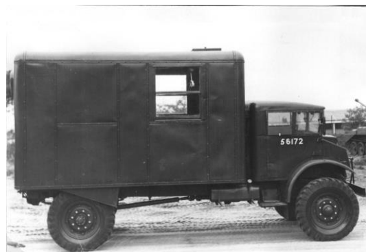
Afb. 14 :

AUTO, BUREAU-, GESLOTEN OPBOUW, NIET AANGEBOUWD : 3 ton, 4x4, C60L. [Chevrolet].