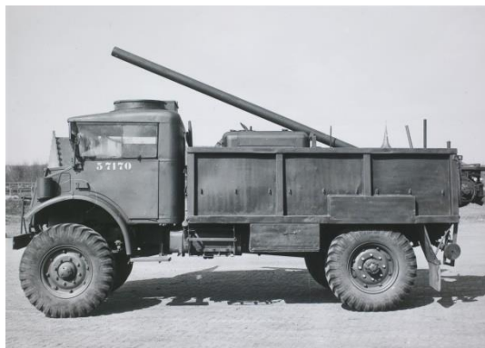
Afb. 13 :

In de open laadbak was een mechanisch aangedreven grondbooruitrusting gemonteerd. De eigenlijke boorinrichting was gemonteerd op een slede voor de neerwaartse geleiding van de grondboor. Daarbij was de geleideboom met slede scharnierend in de laadbak gemonteerd. Voor de aandrijving van de grondboor was gebruik gemaakt van een benzinemotor. Aan de achterzijde van het dragend wielvoertuig onder de laadbak waren twee scharnierende stempels gemonteerd. Deze stempels zorgde voor de vereiste stabiliteit tijdens de boorwerkzaamheden. Met de grondboor konden gaten worden geboord met een diameter tot 508 mm en een diepte tot 2133,6 cm. De hoek waaronder geboord kon worden lag tussen de 0 en 45 graden. Gemiddeld kostte het boren van een gat met de maximum diameter en diepte ongeveer twee minuten. De grondbooruitrusting vertoonde veel overeenkomsten met die welke bij op de Amerikaanse GMC 2,5 ton vrachtauto was toegepast.