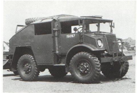
Afb. 20 :

Bij de Nederlandse artillerie-eenheden is dit type voertuig ingezet als trekker van de 25-pounder vuurmond. Medio 1956 stroomde de laatste artillerietrekker van de CMP serie uit.