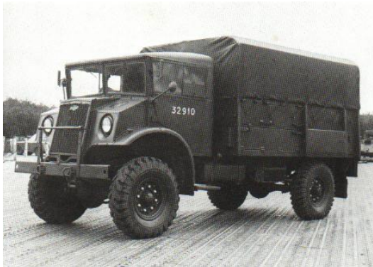
Afb. 21 :