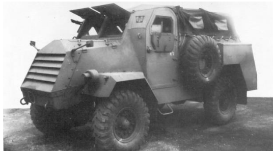
Afb. 18 :

Deze uitvoering vertoont veel overeenkomst met de hiervoor beschreven vrachtauto, gesloten opbouw. Kende de vorige uitvoering geen ramen aan de linkerzijde, bij deze versie waren een viertal ramen aangebracht. Daarbij was de neerklapbare werkbank verwijderd. Bij de Canadese versie was wel een neerklapbare werkbank toegepast. Oorspronkelijk werd het voertuig ingezet als mobiele telefooncentrale met 200 aansluitingen. Dit type wielvoertuig is door de KL niet ingezet als mobiele telefooncentrale. Het merendeel is omgebouwd en ingericht als mobiele werkplaats.