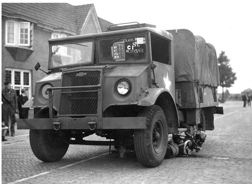
Afb. 22 :

De aantallen welke bij de diverse versies worden vermeld zijn afkomstig van een oud collega uit het mooie Zuid-Limburgse land