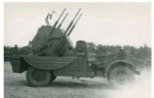
Afb. 19 :