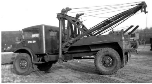
Afb. 15 :

In de werkplaatsruimte was een werkbank aanwezig met de noodzakelijke opbergcapaciteit voor het gereedschap. De bureauversie bod werkruimte aan vier militairen. Bij beide uitvoering was een Johnson aggregaat aanwezig voor de noodzakelijke stroomvoorziening. Voor welke doeleinden dit type door de KL ingezet werd is onduidelijk. Aangenomen kan en mag worden dat dit ongewijzigd overeenkomstig de inzet aan Canadese zijde.