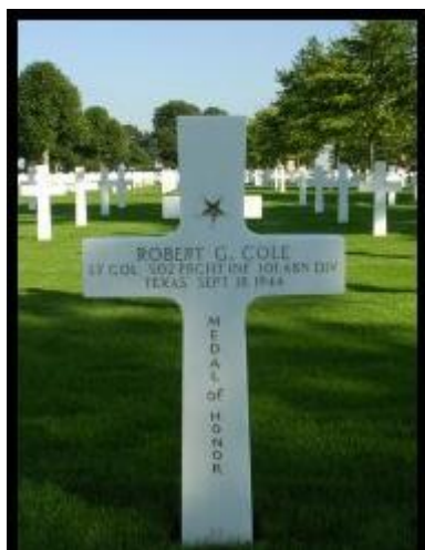
De held van Best Luitenant-Kolonel Robert G. Cole, commandant 3de Parachutistenbataljon, 502d Parachutisten Infanterie Regiment.