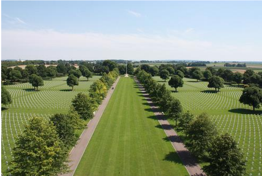
Overzichtsfoto "World War II Netherlands American Cemetery and Memorial".

Aan weerszijden van de trappeningang naar het Ereplein bevinden zich een bezoekersgebouw en museum. Respectievelijk ten noorden en ten zuiden van de trappeningang. In het museum zijn drie landkaarten met daarop de geallieerde opmars met in het bijzonder de Amerikaanse aangebracht. In het bezoekersgebouw is informatie over de begraafplaats verkrijgbaar. Het Ereplein dat omringt is door twee gedenkmuren en voert naar de kapel met de dertig meter hoge toren. Achter de kapel is het ereveld gelegen. Het Ereplein met de spiegelvijver, omgeven door bloemenperken, strek zich uit van de trappen tot de toren. In de noordelijke en zuidelijke muren van het plein staan de namen, rang, eenheid van de gesneuvelden genoemd. Ook staan de namen van 1722 vermisten van de land- en luchtmacht vermeld. De namen zijn uitgehouwen in steen en ingelegd met goudverf /bladgoud. Een later aangebracht sterretje markeert dat die degene later is teruggevonden en geïdentificeerd. Voor de toren staat een bronzen groep voorstellende een treurende gestalte, de duiven, de nieuwe loot aan de door de oorlog vernietigde boom.